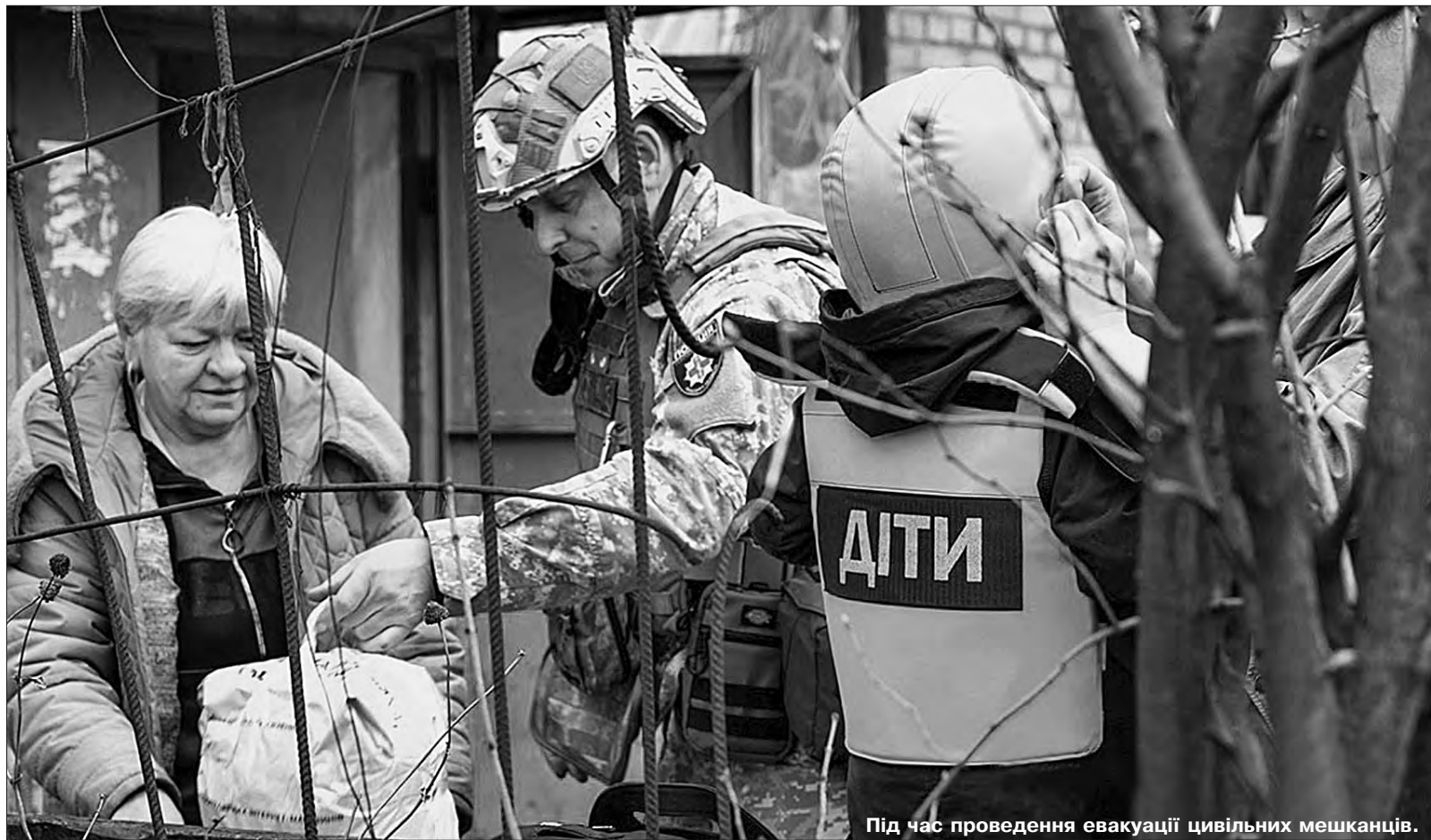
Під час проведення евакуації цивільних мешканців.

Останніми місяцями процес визнання Голодомору геноцидом українського народу значно активізувався. Зокрема, минулого тижня, 23 березня, таке рішення ухвалив парламент Ісландії, 1 лютого — Болгарії, 15 грудня 2022 року — Європарламент, а 30 листопада 2022 року — Бундестаг.