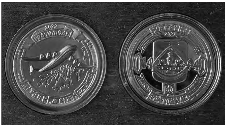
Перші пам'ятні монети «Крила Свободи».